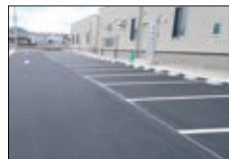
【ライン引き・車止め工事】