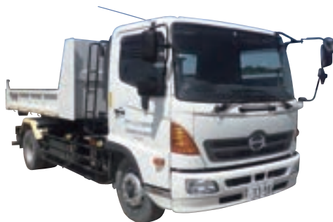
8tフックロールダンプ3398