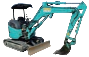
0.15m 3 バックホー(配管付)