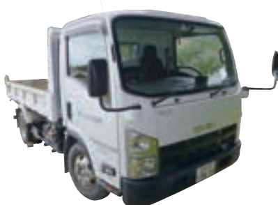
4tダンプセーフティ3616