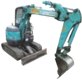
0.15m 3 バックホー