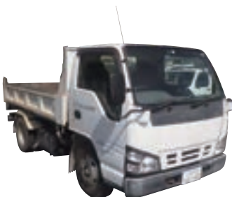
3tダンプセーフティ6160