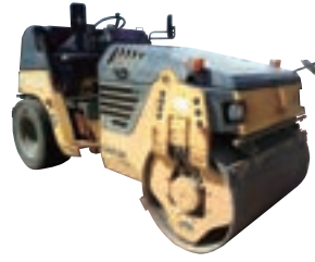
4tコンバインドローラー