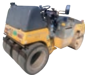
4tコンバインドローラー