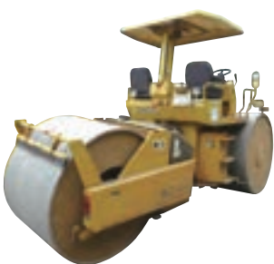
8tマカダムローラー