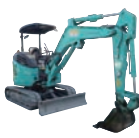
0.15m 3 バックホー(配管付)