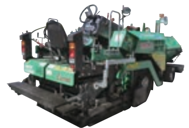
アスファルトフィニッシャー32 1.4~3.2m