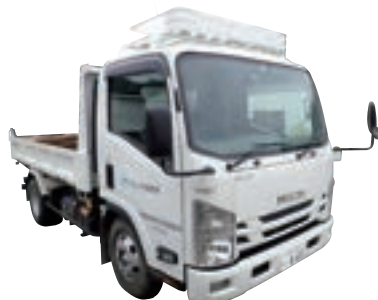
4tダンプセーフティ460