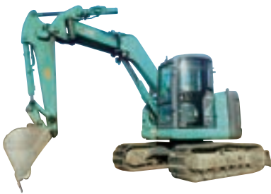
0.25m 3 バックホー