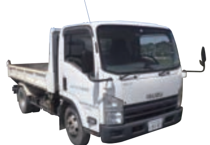
4tダンプセーフティ9187