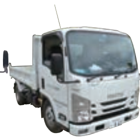
3tダンプセーフティ462