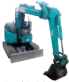
0.15m 3 バックホー