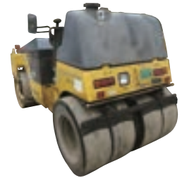
4tコンバインドローラー