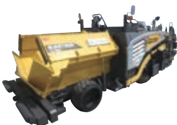
アスファルトフィニッシャー45 2.1~4.6m