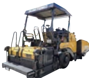
アスファルトフィニッシャー60 2.65~6.0m